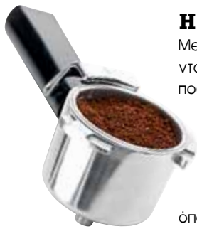
Άρθρο των Coffee Lovers Editors Trainers, Φώτη Λέφα και Σοφίας Μηκουβαράκν.

Θ α πρέπει επομένως κάθε κόκκος να διαμεριστεί, να μετατραπεί δηλαδή σε πάρα πολλά μικρά τεμάχια, ώστε να μπορεί να έρθει σε επαφή το νερό με μεγαλύτερη επιφάνεια καφέ. Έτσι για παράδειγμα εάν τεμαχίσουμε τον κόκκο σε 2.000 κομμάτια, το νερό θα έχει τη δυνατότητα να περάσει σε πιο σύντομο χρονικό διάστημα και να αποσπάσει τις υδατοδιαλυτές ουσίες και τα απελευθερωμένα αέρια από τα κελιά που έχουν δημιουργηθεί από το ψήσιμο του κόκκου. Συμπερασματικά, λοιπόν, όταν μιλάμε για τη διαδικασία της άλεσης εννοούμε πως αυξάνουμε την επιφάνεια που θα έρθει σε επαφή με το ζεστό νερό, ώστε να επιτρέπεται η ταχύτερη μεταφορά διαλυτών στερεών κατά την παρασκευή, δηλαδή την εκχύλιση, να απελευθερώνεται η περιεκτικότητα των αερίων από τα κελιά των κόκκων κατά το άλεσμα.